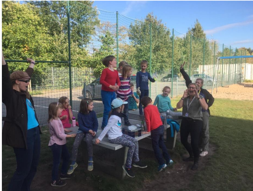
Verjaardagen vieren we graag met elkaar.

persoonlijk benaderen om te vragen of u mee kunt helpen, zodat we met ons allen er een goede en leuke school van kunnen maken waar de kinderen met plezier komen.