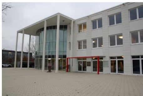
Het gebouw van ISB

Onze dank is groot voor de gastvrijheid van ISB, uiteraard gaan we hier respectvol mee om.