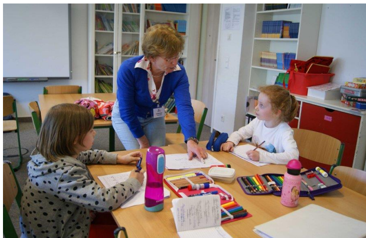
Positieve interactie tussen leerkracht en leerlingen.

Uitgebreidere informatie vindt u in het schoolplan.